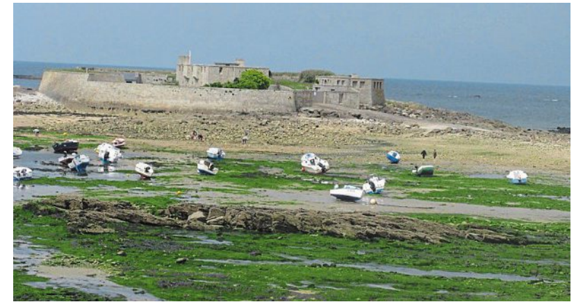
Des dépôts d'algues vertes au Fort-Bloqué.

Plœmeur. Le préfet du Morbihan a adressé un courrier aux maires des communes du littoral pour leur demander de les ramasser.