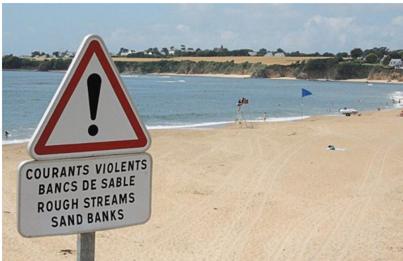
La plage de La Falaise à Guidel est connue pour ses courants violents.

Un témoin a aperçu le groupe en difficulté. Il a donné l'alerte. Les sauveteurs côtiers de Plœmeur et les sapeurs-pompiers plongeurs de Lorient ont été dépêchés sur place. Les deux hommes et les trois enfants ont finalement regagné la plage, aidés par deux surfeurs et un baigneur, pompier volontaire à Bubry. Tous avaient bu la tasse.