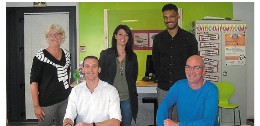
L'équipe Cap Alternance.

Les mesures annoncées par l'État, début juin, encouragent les entreprises à maintenir leurs offres et apportent des garanties aux candidats. « Il n'est donc pas trop tard pour postuler et trouver son alternance dès la rentrée de septembre. »