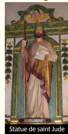
Statue de saint Jude

Il existe de nombreux saints ainsi dénommés : Just à Lyon, à Beauvais, à Valence. Cependant, il existait aussi un culte d’un saint Just dans l’ancien évêché de Vannes en la paroisse d’Alarac. Ce lieu-dit est devenu la commune de Saint-Just actuellement située dans le département de l’Ille-et-Vilaine. La tradition voudrait qu’il ait été un évêque de Vienne exilé dans le pays de Rennes et mis à mort vers l’an 180. Ses reliques étaient signalées dans le Cartulaire de Redon (37-222) en 854 et 913. En 1459, l’abbé de Redon en rendait aveu au duc de Bretagne. Selon d’autres, Just aurait pu être évêque de Rennes.