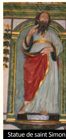
Statue de saint Simon

Il est l’un des douze apôtres souvent associé à saint Simon qui pourrait avoir été son neveu ou son frère selon les différentes traditions. Saint Simon était invoqué pour les semailles et saint Jude pour les causes désespérées. La tradition les fait mourir en Perse. Leur fête est le 28 octobre.