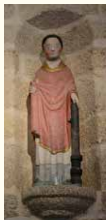
Saint Léonard portant de sa main droite des linges souillés (d'une autre couleur antérieurement) et de la gauche des fers de prisonniers