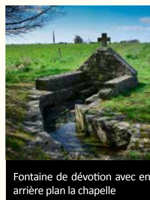
Fontaine de dévotion avec en arrière plan la chapelle

La fontaine de dévotion est située à 200 m en amont de la chapelle en venant du village de Kéranonnel. Protégée des vents par un mur triangulaire de 2 m de large sur 1,20 m de hauteur, l'eau s'écoule par une rigole, agrémentée d'une cupule et bordée de bancs de pierres. Cet aménagement permet aux chiens de laper l'eau sans souiller la fontaine. La croix de granite qui orne la fontaine a été réalisée en 1999 par M. Raymond Dematteo et la statue de Saint-Léonard par Mme Renée Sinquin en 2006.