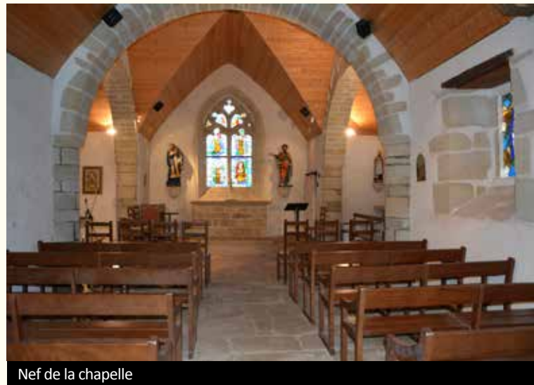
Nef de la chapelle

L'intérieur est en forme de croix latine. Au croisement du transept, il existe trois arcs plein cintre. La chapelle renferme un Christ en bois polychrome. La fenêtre du maître autel murée a été rouverte en 1988.