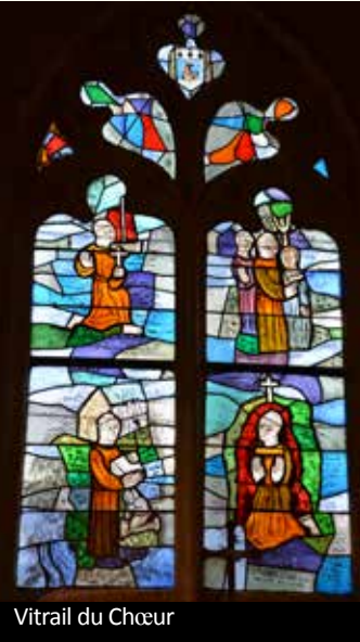
Vitrail du Chœur