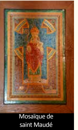
Mosaïque de saint Maudé