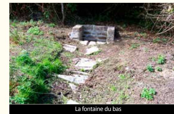
La fontaine du bas