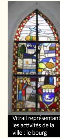
Vitrail représentant les activités de la ville : le bourg