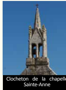
Clocheton de la chapelle Sainte-Anne

Le rond-point du général Koenig a été réalisé en 1993 au moment du percement des boulevards du maréchal Leclerc et du général De Gaulle, qui contournent le Centre-Ville. Sur ce rond-point est érigée une stèle en l'honneur du général Koenig. Une plaque posée sur la stèle rappelle les dates de la bataille de Bir-Hacheim dans le désert de Libye, au sud de Tobrouk, pendant la Seconde Guerre mondiale (du 26 mai au 11 juin 1942). Cette stèle honore le général Koenig et les soldats des Forces françaises libres qui ont contribué à ce que la France recouvre sa liberté après la Seconde Guerre mondiale.