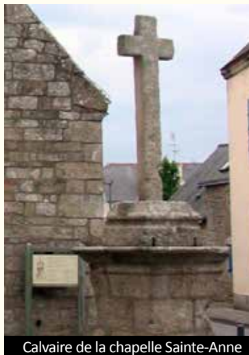
Calvaire de la chapelle Sainte-Anne

À l'entrée de la chapelle se trouve un calvaire (classé Monument Historique) avec un soubassement à trois degrés.