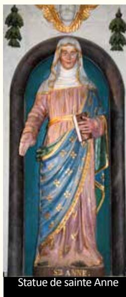
Statue de sainte Anne

Sainte Anne est la mère de la Vierge Marie et donc la grand-mère de Jésus. Le culte de sainte Anne, limité longtemps à quelques sanctuaires, se répandit dans le monde catholique à partir du XIV e siècle. D'après la tradition chrétienne, après un mariage de vingt ans sans enfants avec Joachim, Anne enfanta Marie.