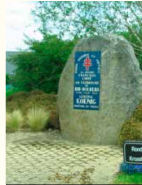
Stèle en l'honneur du général Koenig

Le rond-point du général Koenig a été réalisé en 1993 au moment du percement des boulevards du maréchal Leclerc et du général De Gaulle, qui contournent le Centre-Ville. Sur ce rond-point est érigée une stèle en l'honneur du général Koenig. Une plaque posée sur la stèle rappelle les dates de la bataille de Bir-Hacheim dans le désert de Libye, au sud de Tobrouk, pendant la Seconde Guerre mondiale (du 26 mai au 11 juin 1942). Cette stèle honore le général Koenig et les soldats des Forces françaises libres qui ont contribué à ce que la France recouvre sa liberté après la Seconde Guerre mondiale.