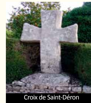
Croix de Saint-Déron

La croix de Saint-Déron, non datée, pourrait remonter au Moyen-âge. C'est une croix de carrefour qui a été déplacée sur un mur maçonné. Le socle est en ciment. Elle est largement pattée avec le fût chanfreiné à gauche. Elle a une hauteur de 1,70 mètre.